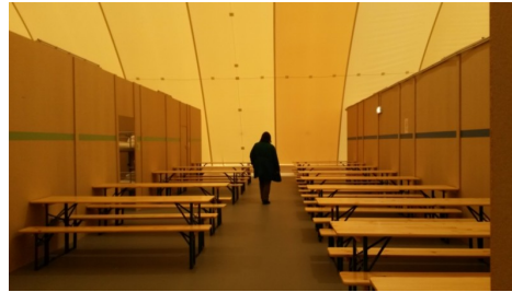
Traglufthalle in Hall für 240 Menschen

Samstag, 27. Februar 2016, 19 Uhr im Begegnungs-Bogen Ing.Etzel-Straße 37, Innsbruck