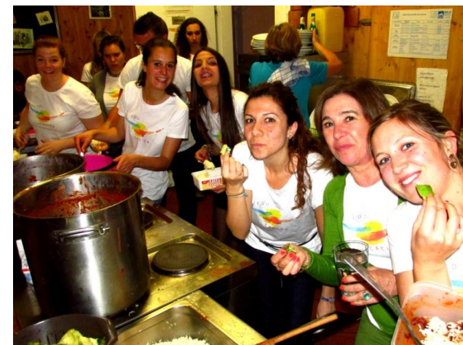
23.05.2014 - Dinnerclub-Besucherrekord: 230 Gäste beim Ecuadorianischen Abend während der Langen Nacht der Kirchen