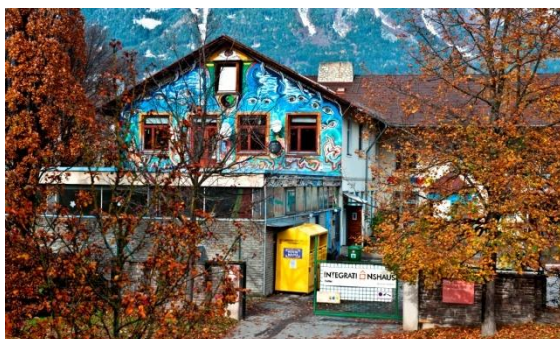
🍁 Hearst Herbert, herrlich wie es herbstet!!! 🍁

Genießen Sie Ihre Zeit mit uns im Integrationshaus 2 x wöchentlich warmes Essen von 19-21 Kulturprogramm bis 22 für Mitglieder und Freunde